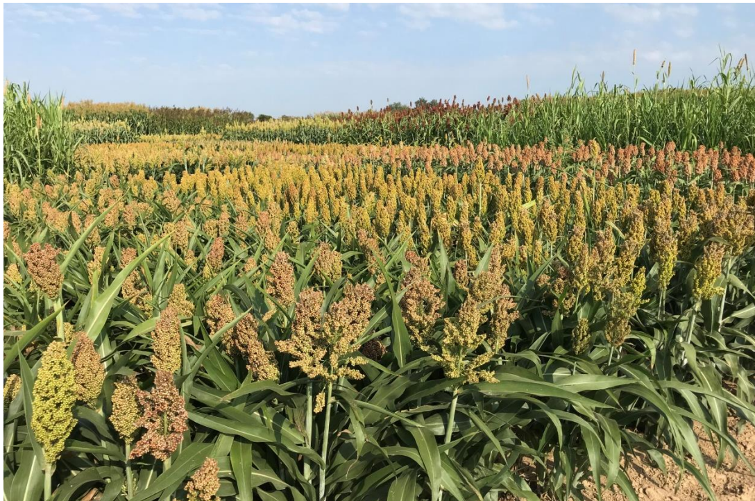
Abbildung 1: Blick über den Körnersorghum-Versuch 2018

Das bewährte Sorghum-Sortenscreening des TFZ verlief unter den diesjährigen extremen Witterungsbedingungen zumindest in Straubing sehr positiv für Sorghum, da hohe Temperaturen und viele Sonnenstunden beste Wachstumsbedingungen boten. Der Lössboden konnte für das tiefwurzelnde Sorghum lange Bodenwasser nachliefern, Trockenstress wurde hier nicht beobachtet. Der Silomais reifte im Gegensatz dazu viel schneller ab als gewohnt und wurde daher leider im Versuch zu spät beerntet. Das parallel in Aholting auf sandig-kiesigem Boden durchgeführte Screening musste hingegen schon Mitte August abgebrochen werden, da der Versuch hier komplett vertrocknete. Durch die extreme Trockenheit zeichnete sich jede kleine Bodenunregelmäßigkeit massiv ab, so dass keine Auswertung zum Vergleich der Sorten möglich war.