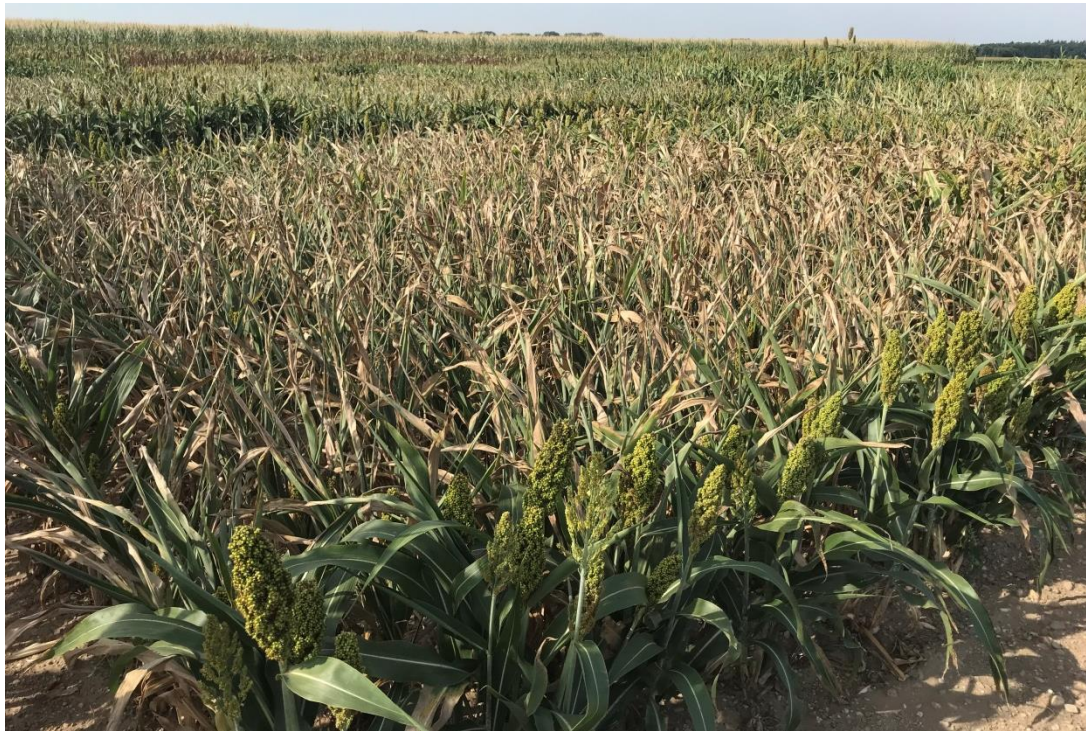
Abbildung 2: Blick über das verworfene Screening in Aholting 2018