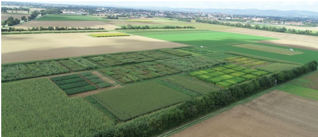
Abbildung 1: Blick über die Versuchsfläche 2019: mittig auf der Versuchsfläche das Sorghum-Sortenscreening mit Lager sowie teilweise wieder aufgerichteten Sorten; Lager auch in anderen Sorghumversuchen dahinter sichtbar

In 2019 konnte sich das Sorghum-Sortenscreening unter warmen bis heißen Temperaturen und ohne Trockenstress, also bei besten Wachstumsbedingungen entwickeln. Am 12. August wurden die höheren Sorten durch ein starkes Gewitter ins Lager gedrückt. Einzelne Sorten schafften es zwar, sich wieder aufzurichten (siehe Abbildung 1 im Vergleich zu Abbildung 2), kurz vor Ernte herrschte aber leider wieder Totallager vor.