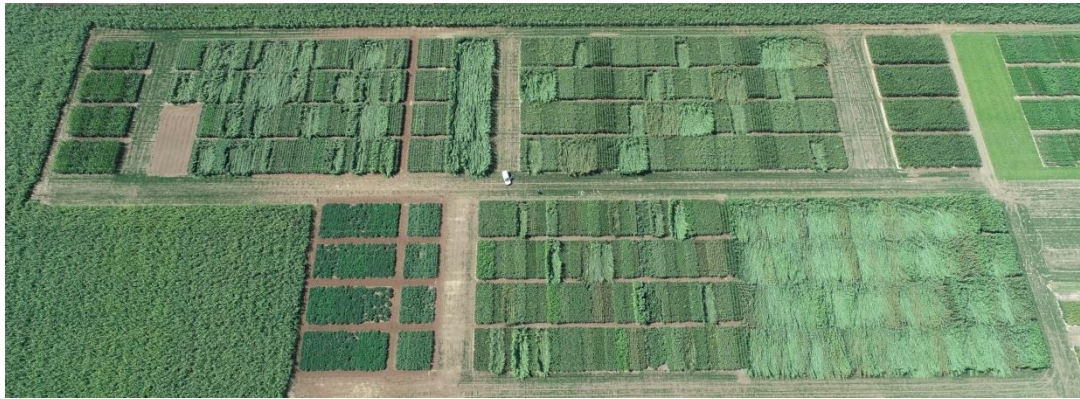
Abbildung 2: Detailblick über das Sorghum-Sortenscreening 2019 in der unteren Bildhälfte: rechts der nahezu vollständig lagernde Versuchsteil mit S. bicolor -Silo- sowie S. bicolor x S. sudanense -Sorten; links der Versuchsteil mit S. bicolor -Körnersorghum sowie einigen anderen Sorten/Arten

Das Sortenscreening bestand, um die stark unterschiedliche Pflanzenhöhe zu berücksichtigen und Beschattungseinflüsse zu minimieren, aus zwei getrennten Versuchsteilen: Die S. bicolor -Futtersorten und S. bicolor x S. sudanense -Sorten wurden zusammen in einer Blockanlage angebaut und eine zweite Blockanlage für die Körner- und Dualsorghumsorten inklusive der Pennisetum glaucum -Sorte (Abbildung 2) angelegt. Auch der Referenzmais wurde in einer separaten Blockanlage zu zwei verschiedenen Säterminen angelegt. Jede Sorte wurde in Doppelparzellen in vierfacher Wiederholung angebaut, die Beerrichtung der Kernreihen umfasste jeweils 11,4 m 2 Fläche. Die Versuche standen auf Parabraunerde aus Lösslehm mit Ackerzahl 76 im Straubinger Gäuboden nach Vorfrucht Winterweizen und Zwischenfrucht Senf, der bereits im Herbst 2018 untergepflügt wurde. Aufgrund der hohen N min -Gehalte vor Saat wurden am 05.06. nur geringe Mengen Stickstoffdünger benötigt, um den Stickstoffbedarf der Kulturen zu erfüllen. Am 07.06. wurde mit 1,5 l/ha Buctril behandelt, Herbizide gegen Unkrauthirschen waren wegen Wasserschutzgebietsauflagen nicht zulässig. Tabelle 1 enthält die Anbauparameter.